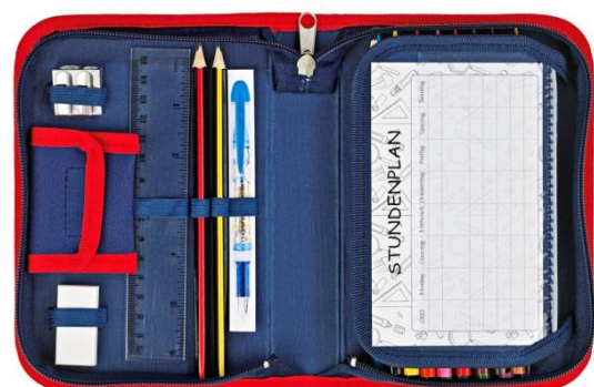
Mäppchen mit Geldbeutel + Sichtfester für Stundenplan